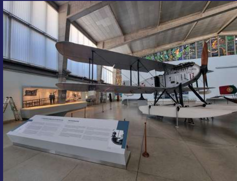
Pavilhão das Galeotas - Museu de Marinha

O atual espaço, para além dos 3 modelos de hidroaviões suprarrefecidos, conta com um acervo notável de importância significativa para a História da aviação nacional e mundial. É um dos espaços que mais curiosidade desperta entre os visitantes.