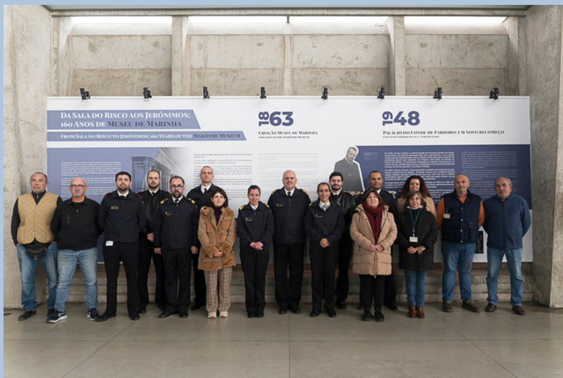
Guarnição do Museu de Marinha: Direção, Serviço de Investigação, Serviço de Património e Serviço Educativo.

Preparados para mais um ano repleto de histórias, aventuras e muita maritimidade? A guarnição do Museu de Marinha deseja a todos um excelente ano de 2024, especialmente aos que estão em missão ou de serviço. Esperamos por si, mais um ano, para conhecer e dar a conhecer o Museu de Marinha ao Mundo.